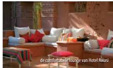
de comfortabele lounge van Hotel Awasi

de luxe in deze prachtige omgeving. Voor de heuse levensgenieter zijn de wijnroutes, welke Sapa Pana Travel voor u kan samenstellen, een echte aanrader. Vraag Sapa Pana Travel ook om een wijnnadvisie!