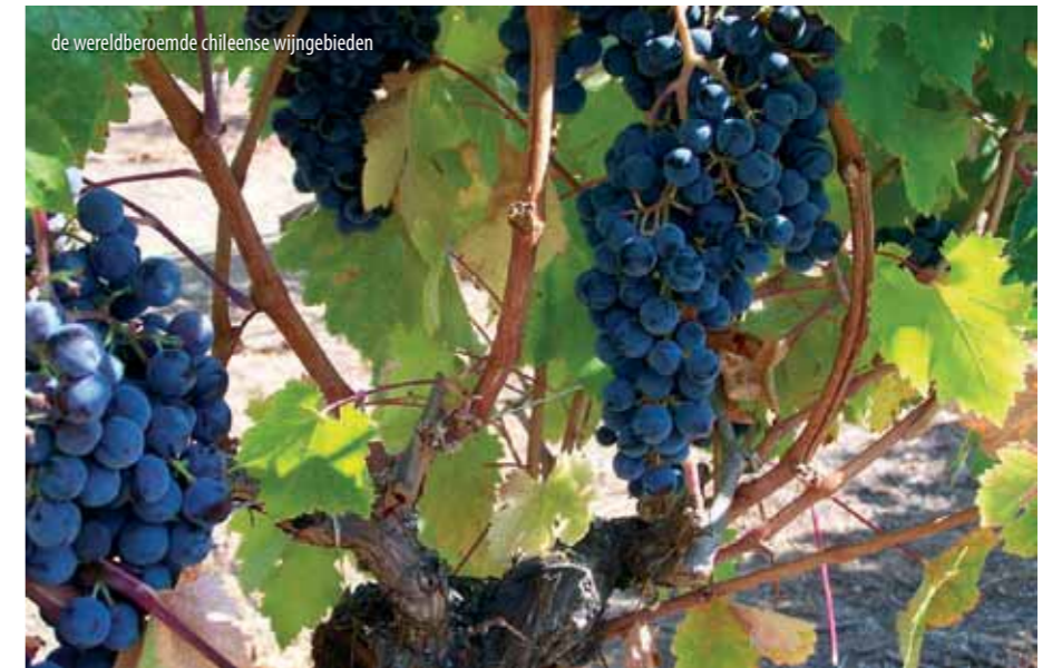
de wereldberoemde chileense wijngebieden