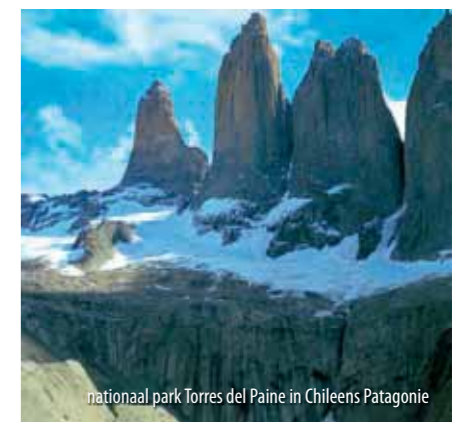
nationaal park Torres del Paine in Chileens Patagonië